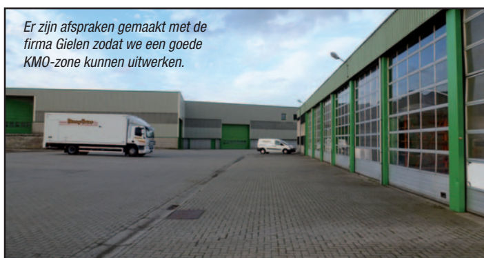
Er zijn afspraken gemaakt met de firma Gielen zodat we een goede KMO-zone kunnen uitwerken.

Zo willen wij benadrukken dat de ligging van de KMO-zone volgens ons niet gelukkig is, wegens te dicht bij de woonkernen. Hieraan valt echter niet te tornen en dus moeten wij het met deze zone op die plaats doen.