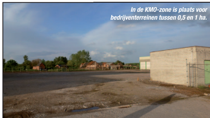
In de KMO-zone is plaats voor bedrijventerreinen tussen 0,5 en 1 ha.