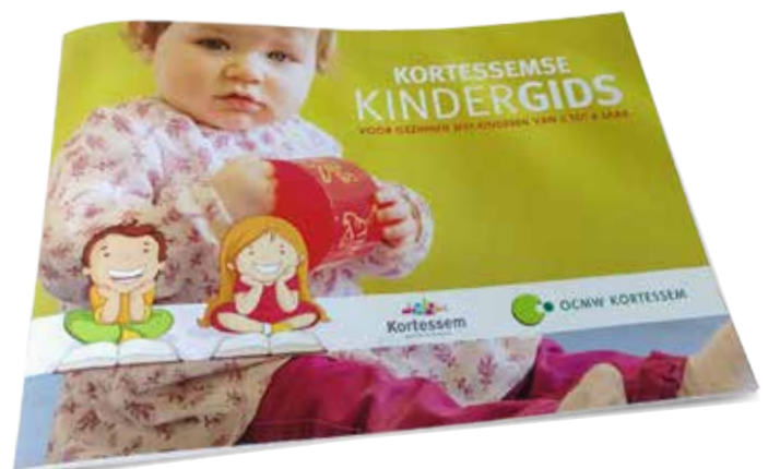
► Vragen over kindershulp en andere zaken? Deze gids geeft u een antwoord.

met de onthulling van de Levensboom 2016. Hierbij was ook Kinderwens Vlaanderen te gast om het onderwerp kinderwens bespreekbaar te maken.