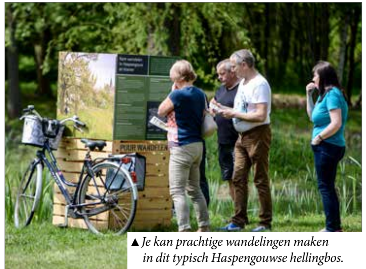
▲ Je kan prachtige wandelingen maken in dit typisch Haspengouwse hellingbos.

Op 16 juni ondertekenden het Agentschap Onroerend Erfgoed, de provincie en het Regionaal Landschap Haspengouw en Voeren (RLHV) een intentieverklaring om de Haspengouwse hoogstamboomgaarden te koesteren als waardevolle streekeigen